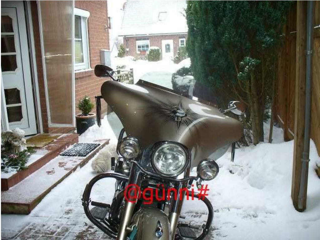
Und mit stolzem Besitzer